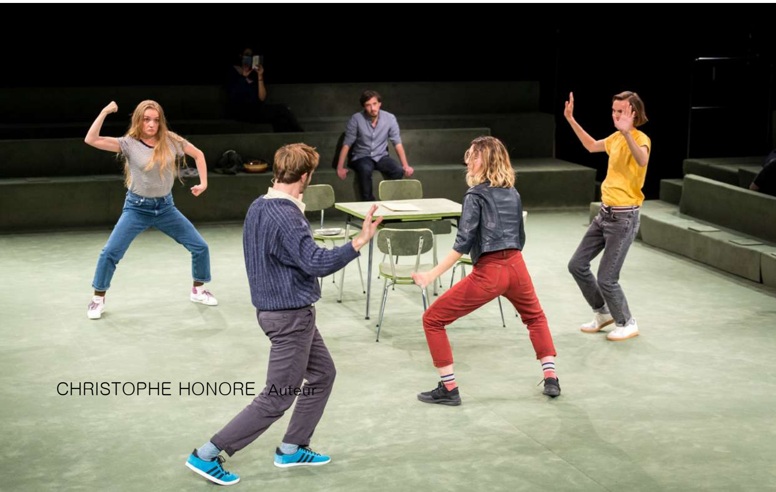
CHRISTOPHE HONORE Auteur

C'est la première fois, en tant que metteur en scène homosexuel, que je vais traiter ce sujet sur le plateau. Avant je pensais que ce n'était pas un sujet, j'ai radicalement changé : non seulement je pense que c'en est un mais c'est peut-être le sujet essentiel pour moi aujourd'hui. Ce spectacle-ci est plus politique – politique de l'intime, comme je le disais. Aujourd'hui, je ne suis plus en repos, je suis devenu plus inquiet. J'ai des liens très forts avec le Brésil et, depuis l'arrivée au pouvoir de Jair Bolsonaro, je ne dors plus sur mes deux oreilles. J'ai radicalement changé ma manière d'être au monde, mon engagement. S'il y a un nouveau chemin artistique pour moi c'est de prendre la parole, d'arrêter d'être discret. Avant, la discrétion, je trouvais que c'était une élégance, maintenant, je n'ai plus envie d'être discret.